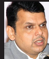
देवेन्द्र फडनवीस मुख्यमंत्री

मुंबई। मालाड पश्चिम में मालाड पुलिस स्टेशन के पास स्थित गार्डन बीयर बार के मामले में काफी तूल पकड़ लिया है। इसके खिलाफ कई हिंदुवादी संगठनों ने मोर्चा खोल दिया है और बंद कराने को लेकर प्रदर्शन व धरना की योजना बनाने लगा है। जैसा कि आपको मालूम है कि मालाड पश्चिम में मालाड पुलिस स्टेशन के पास स्थित गार्डन बीयर बार हिंदुओं की पूजास्थली एक मंदिर और देवलोक गमन के वास्ते निर्मित श्मशान भूमि के बिल्कुल पास स्थित है। जहां शराबियों की धमाचौकड़ी जारी रहती है जिससे पूजा के लिए मंदिर आये भक्तों और श्मशान में चिता जलाने आये लोगों को भारी परेशानी का सामना करना पड़ता है। (शेष पृष्ठ 5 पर)