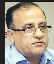
अजोय मेहता मनपा आयुक्त